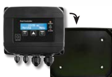
Staffa da parete opzionale Wall support as an option Soporte de pared opcional Support mural en option